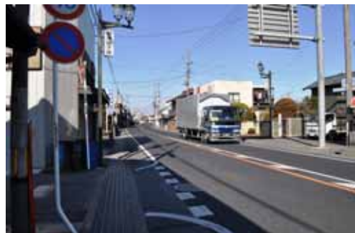
旧例幣使街道境村

群馬県立文書館では、『収蔵文書目録30集 佐波郡境町東福島英一家文書、利根郡新治村 新治村布施区有文書』をこのたび刊行しました。そこで、両地域の古文書と写真パネルを通して、南・北上州村々の姿の移り変わりやそこに生きた人々の営みを紹介します。