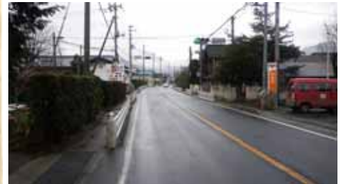
現在の布施宿付近