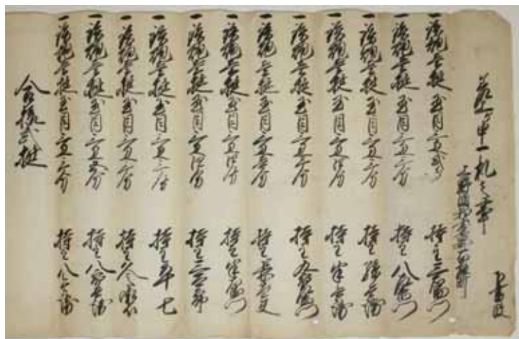
「差上ヶ申一札之事(鉄炮12丁預り証文)」(P8704-163)

また、展示開始の6月9日は、「国際アーカイブズの日」(2008年制定)にあたります。この日を機に、国・地方公共団体、企業などが作成、取得したいろいろな文書や記録を保存し、利用を図ることの大切さをPRしていきます。