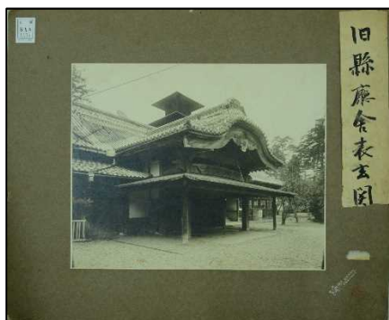
A0181A0B 5437 「旧県庁舎写真」