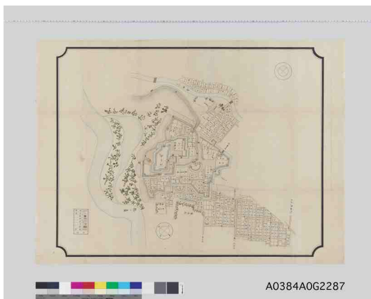
『古城附属 前橋城図』