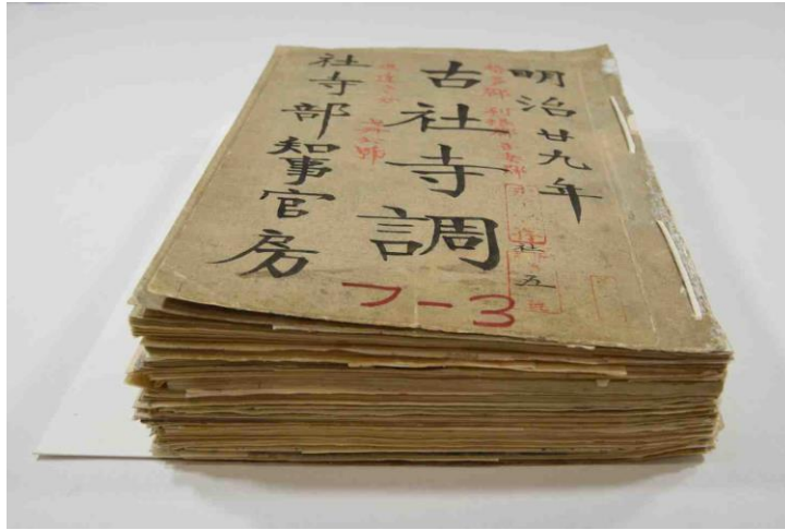
『古社寺調(七冊六号、進達セシ分、「勢多郡古社調」、「利根郡古社調」)』